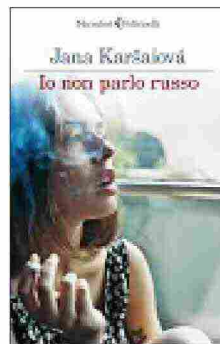
Io non parlo russo di Jana Karšaiová, Feltrinelli (pagg. 144, euro 15,20).

Vi è piaciuto questo libro? Volete segnalarne un altro? Mandate una mail a iodonnapremioletterario@rcs.it . È gradita una breve motivazione.